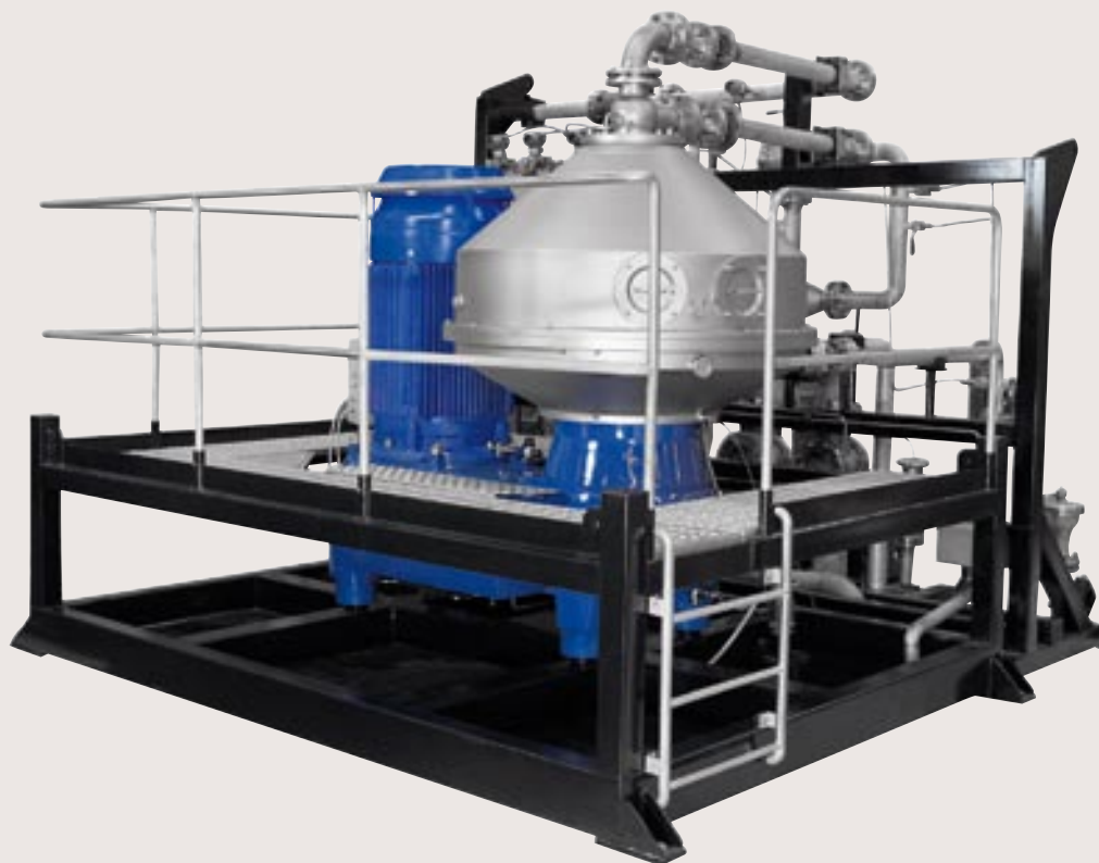
Сепаратор X20 в комплекте с несущей рамой.

Установка X20 компании Альфа Лаваль, модель OFSX 520S-71CEGPX, представляет собой высокопроизводительный сепаратор, предназначенный для очистки пластовой воды от нефти. Основу установки составляет надежная в эксплуатации конструкция тарельчатого центробежного сепаратора, оснащенного барабаном с выгружающими соплами, специально разработанная для эксплуатации в тяжелых условиях нефтедобывающей промышленности. Установка соответствует требованиям Категории 2 Директивы ЕС АTEX по пригодности оборудования для работы в потенциально взрывоопасных зонах с уровнем опасности 1 и 2. В качестве дополнительной опции предусмотрена возможность работы агрегата при избыточном давлении до 400 кПа, с использованием корпуса, рассчитанного для работы под давлением в соответствии с требованиями ASME. Входящий в модельный ряд установок X20 сепаратор X20 также может быть применен в технологических процессах обезвоживания тяжелой сырой нефти и нефтесодержащих песков.